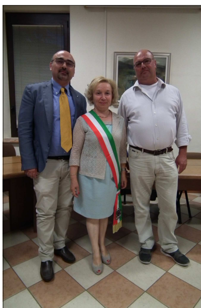
La Giunta Comunale