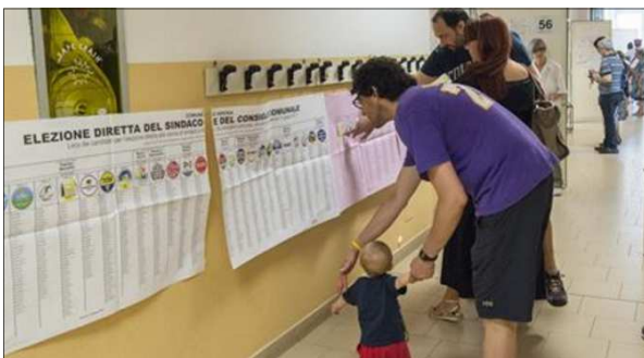
Affluenza alle 19 Città maglia nera Cazzano la migliore