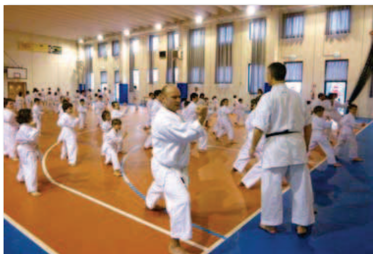
Stage del 13 Febbraio palestra "Francesco Bertolaso"