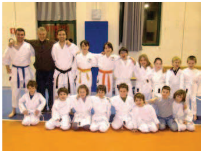
Fashion Body Karate Cazzano