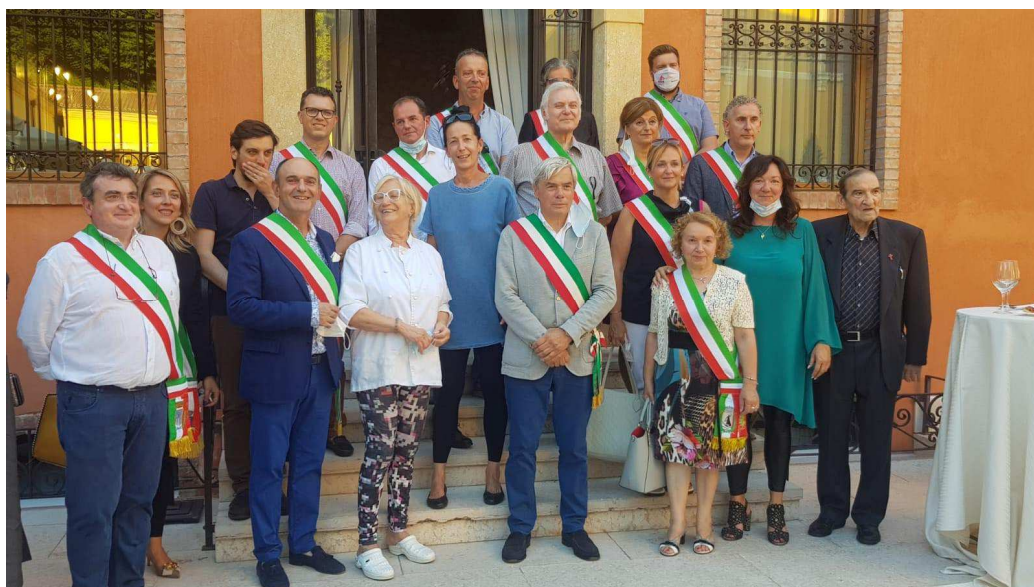
Ringraziamento ai medici, infermieri e operatori socio-sanitari dell'Ospedale Fracastoro che hanno lottato contro il Coronavirus